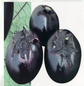
AUBERGINE F1 SP Fruit rond aplati Fruit de 10cm de long et de 11-12 cm de diamètre Poids 200 -400g