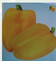
Type déterminé, Poids moyen fruit: entre 150 et 250g Rendement 60 000kg / hectare sous une température variant entre 24 et 26 °C