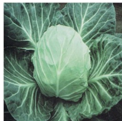
CHOU Hybride F1- He Vert clair- Poids 0,8-1,00kg Maturité très précoce :50 jours . Bonne saveur