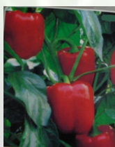
Type déterminé, Poids moyen fruit: entre 150 et 200g Rendement 60 000kg / hectare sous une température variant entre 24 et 26 °C