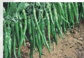
PIMENT F1 EL Maturité semi précoce Poids 32g - Longueur 16cm Diamètre 3cm Résistance TMV CMV Piment piquant