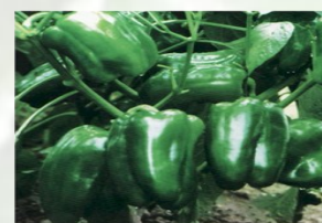
POIVRON F1 AD Maturité moyennement précoce. Poids 80-100g Résistance TMV CMV Résiste au transport