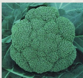
BROCOLI F1 Vert foncé -Poids 0,6 Kg Maturité précoce :60 jours après repiquage Résistance à TuMV