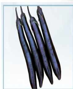
AUBERGINE F1 R Long Maturité semi précoce Fruit de 35cm de long et de 4-5 cm de diamètre