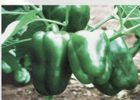
POIVRON F1 SW Maturité semi précoce Poids 48g - Longueur 20cm Diamètre 2,8cm Résistance TMV CMV