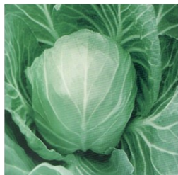
CHOU Hybride F1-T-Gr Poids 1,2-1,4kg Maturité très précoce :55 jours après repiquage Tolérance à la montée immature. Bonne saveur