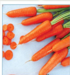
Carotte F1 MANGA Coloration rouge orange Longueur 18-20 cm Résistance à la chaleur et à Alternaria et Oidium