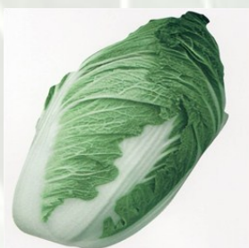
CHOU CHINOIS F1 Au moins 10 variétés au bon goût typiquement chinois d'une grande résistance aux maladies