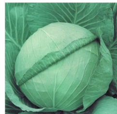
CHOU Hybride F1- Geant Vert foncé- Poids 2,8-3,2kg Maturité :75 jours après le repiquage.Bonne adaptation Résistance à TuMV et la pourriture noire